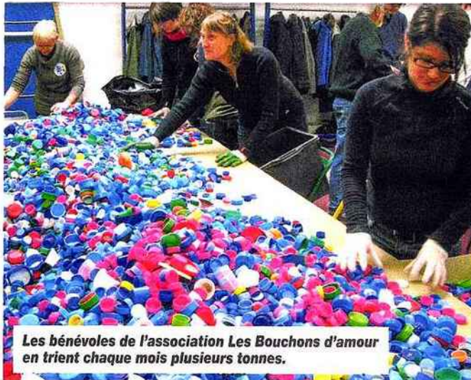
Les bénévoles de l'association Les Bouchons d'amour en trient chaque mois plusieurs tonnes.

Un peu de place dans un placard pour stocker les sacs de bouchons et le carburant pour les porter au centre de stockage.