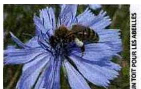
UN TOIT POUR LES ABEILLES

→ Tél. : 05 17 26 10 23 ; www.untoitpourlesabeilles.fr